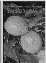
A metszés részletes szabályai Nyíró Ferenec-Sarányi Dezső: Kajsziabarack című könyvében (Mezőgazdasági Kiadó, Budapest, 1981) olvashatók el.

A kajszi fák a szőlővel azonos talajokat kedvelik; a homokon és az agyagtalajokon egyaránt megélnék. Kezdetben felfelé törekvő, később ellaposodó, ernyőszerű koronát fejlesztenek, ezért legalább 6x6 méteres tenyészterületre (36 m 2 ) van szükségük. A lombkorona nem ad mély árnyékot, ezért a fák alatt a szamóca, sőt a zöldségfélék is megtermelhetők.