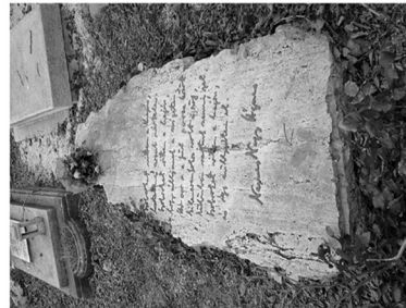
Sírkő a Farkasréti temetőben